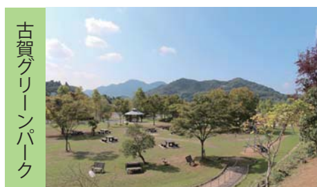
古賀グリーンパーク

ウィザスどんぐりは、古賀グリーンパークの一角にたたずむ緑豊かで静かな住まいです。大きなキッチンを備えた中庭が見渡せる共有スペースは、お食事やだんらん、趣味活動などに利用できます。