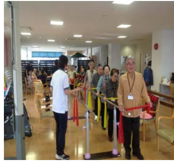
筋力向上トレーニング