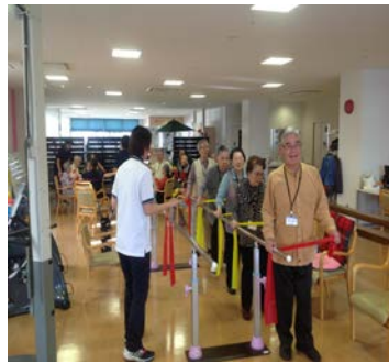
筋力向上トレーニング