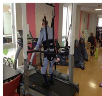
歩行トレーニング