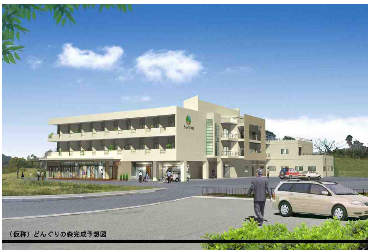
(仮称) どんぐりの森完成予想図

古賀グリーンパーク内の第2期整備事業として、古賀市の公募で豊資会が選ばれ、リーディングプロジェクトエリア内に計画を進めてまいりました高齢者総合福祉センター、「ハイマートど