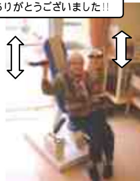
プッシュアップブルダウン 「物を持ち上げる」 「背中湾曲を防ぐ」

（ちょっとお知らせ） はなみ介護センターでは身体介護と生活援助の訪問介護も行っております。