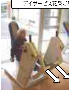
レッグプレス 「立ち上がり」 「歩行」

デイサービス花梨ご利用者に写真のご協力をいただきました。ありがとうございました!!