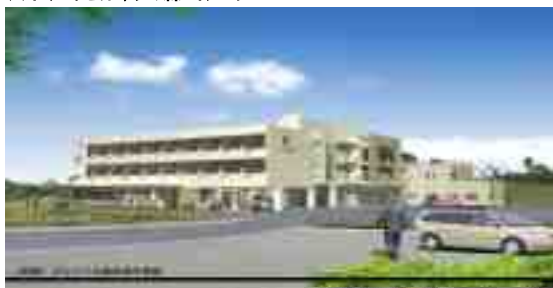
ハイマートどんぐりの森 イメージ

前回速報でお伝えしました「ハイマートどんぐりの森」がいよいよ入居予約を開始しました。今回はその全貌を徹底解剖します。