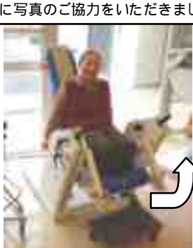
レッグエクステンション カール 「階段昇り降り」 「ひざ折れ防止」