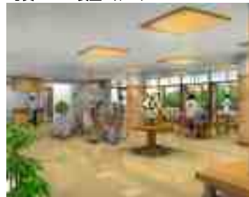
写真 1F食堂 イメージ

リビングダイニングルーム機能訓練室は、10部屋ごとに設けています(写真)。また、1階には一般の方もご利用可能な食堂を計画しています(写真)。