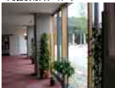
木を使用したサッシ イメージ

一般的に施設と呼ばれる建物は防災の意味もあり木造は好ましくないとされています。「ハイマートどんぐりの森」の構造も鉄筋コンクリート造です。しかし建物の「あたたかみ」を表現する上で木はかかせません。多くの施設でも木を多く使うという努力はされているはずですが、そしてハイマートどんぐりの森では出入口のサッシに木とアルミの複合サッシを取り入れました。