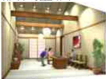
グループホーム交流室 イメージ

本体施設に隣接する2階建てのグループホームどんぐり。認知症高齢者が各階ごとに9名単位で共同生活を行う場所です。このグループホーム入り口外のホールの部分に交流室を設ける計画が立案されたときにまさきに思い立ったのが、 地域の民家を意識したしつらえ を表現できないか、ということでした。誰でも馴染みの深いものには心の安らぎを覚えます。そこで人と人とのふれあいの場である交流室に居蔵造りを取り入れ、さまざまな用途で使用できればと考えました。グループホームの入居者様が家族との団欒を過ごされるのも良し、職員やボランティアの休憩や会議として、また、地域の方や見学者の休憩所としても利用できます。