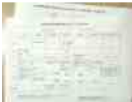
参考)クリティカルパス

当院では、患者様にとって最も不安が大きい入院・手術というものに対し、「クリティカルパス」というものを導入して治療・看護をおこなっております。これは入院から退院までのスケジュールを表にまとめているものです。患者様やご家族の方へ表にもとづいてご説明させていただくことで、退院までどのような流れになるのか経過が理解し