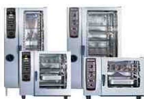
真空調理で使用される機器

開設まであと4ヶ月と迫って参りましたが、ハイマートどんぐりの森。ケアハウス・グループホーム・デイサービスなど現在予約受付中です。