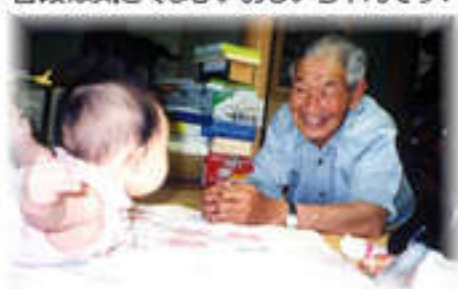
普段は気さくなひいおじいちゃんです!

人のために努力を惜しまない生き方に、我々医療福祉人としての大切な「心」を改めて教えていただきました。これからもお達者で!!