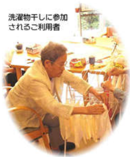
洗濯物干しに参加されるご利用者

一般的に高齢になると体の機能が徐々に衰え、おのずとできる事も減少していきます。そういった方に対して、できるだけ役割を持つていただき、それぞれの「利用者」が自分が必要とされているんだと感じていただきたいのです。そして職員が「ありがとうございます」と感謝で応える事で、その瞬間、「ご利用者が「主役」になることができます。 自信を持ち、生き活きとした笑顔を見せていただく事で、スタッフの元気の源にもなります。