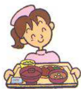
表1:点数の変更について

また、今まで透析の患者様は更生医療の適応でしたが、今回より更生医療が廃止され自立支援医療となりました。自立支援医療では、収入に応じた自己負担金が発生しました。(自己負担分については、今まで通り自治体により、支給体制が取られていますが、期限付きとなり注意が必要です。)また入院について、今まで更生医療の適応となる入院(シャントトラブル・肺水腫等)につきましては、入院時食事療養費は更生医療より支給されていましたが、4月より自己負担となりましたのでご注意ください。