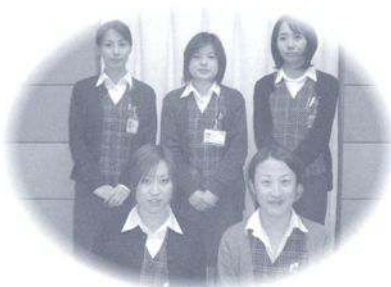
期待の若手スタッフ5人衆

※レセプト・診療報酬明細書。皆様が窓口で支払われているのは、医療費の1/3割であり、残りの金額は医療機関から採算者にて請求されています。