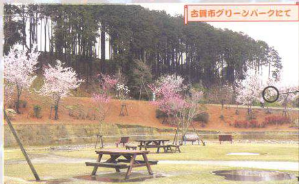
古賀市グリーンパークにて

迅速・正確・気配りをモットーに自分や家族が心から利用したいと思える医療・福祉サービスを提供する